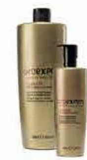
Ochranný šampon 1000 ml - OE13017 500 ml - OE13018