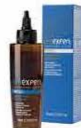
MIRACLE 150 ml OE14039