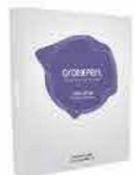
Oroexpert Blonde Nirvana vzorník