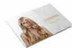
Oroexpert brožura pro koncové klienty