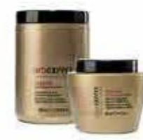
Ochranná maska 1000 ml - OE13022 500 ml - OE13021