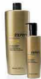
Vyživující kondicionér 1000 ml - OE15027 300 ml - OE15028