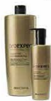
Ochranný kondicionér 1000 ml - OE13019 300 ml - OE13020