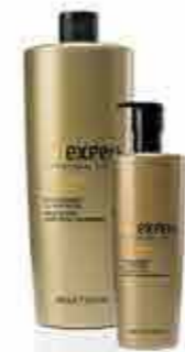
Vyživující šampon 1000 ml - OE15025 500 ml - OE15026