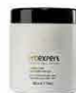
Blonde Divine odbarvovací prášek 500 g OE12015