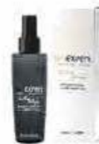
Sprej pro lesk vlasů 100 ml OE18144