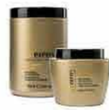
Vyživující maska 1000 ml - OE15030 500 ml - OE15029