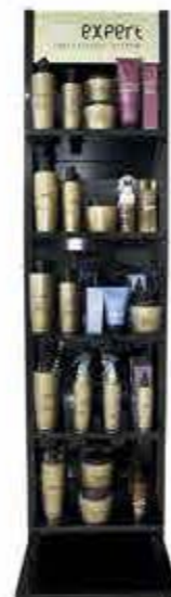
Oroexpert single stojan