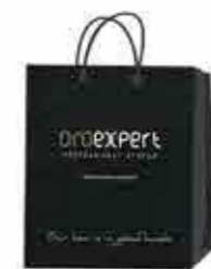
Oroexpert papírová taška