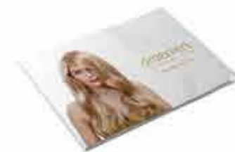
Oroexpert produktový katalog