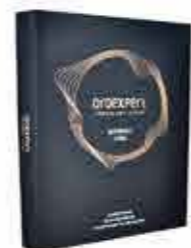
Oroexpert vlasový vzorník