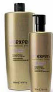
Šampon pro objem 1000 ml - OE17042 500 ml - OE17043