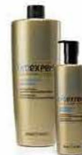
Rekonstrukční šampon 1000 ml - OE14033 500 ml - OE14034