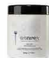
Balayage odbarvovací prášek 450 g OE12016