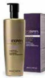
VOLUPTUOUS 200 ml OE17044