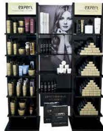
Oroexpert double stojan