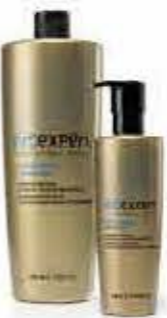
Rekonstrukční kondicionér 1000 ml - OE14035 300 ml - OE14036