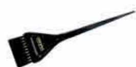
Oroexpert barvicí štětec