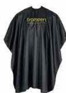
Oroexpert kadeřnický plášť