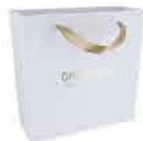
Oroexpert dárková taška