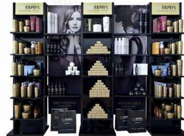
Oroexpert triple stojan