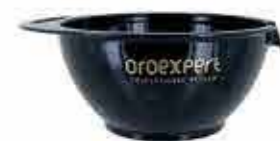
Oroexpert miska na barvení