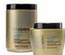
Rekonstrukční maska 1000 ml - OE14038 500 ml - OE14037