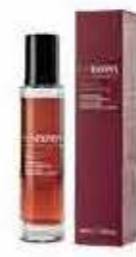
Shine Sublime Serum 100 ml OE13024